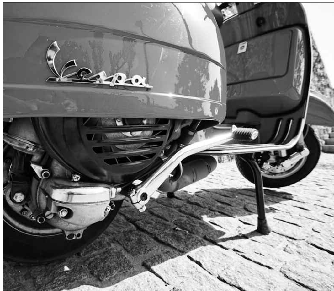
Η 26η πανελλήνια συνάντηση των κατόχων και φίλων του θρυλικού σκούτερ είναι η δεύτερη κορυφαία εκδήλωση του χώρου που αναλαμβάνει μέσα στο 2012 η Vespa Club Volos

Περισσότερες πληροφορίες, όπως για το κόστος διαμονής στο κάμπινγκ, μπορούν οι ενδιαφερόμενοι να βρουν στο επίσημο site της λέσχης: http://www.vespaclubvolos.com .